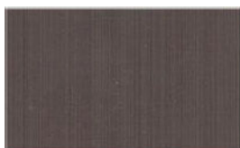
Wskaźnik pola magnetycznego

zadziałało silnym polem na kliszy kontrolnej widoczna będzie jasna plama. Kliszy można używać wielokrotnie, nie ulega ona zużyciu.